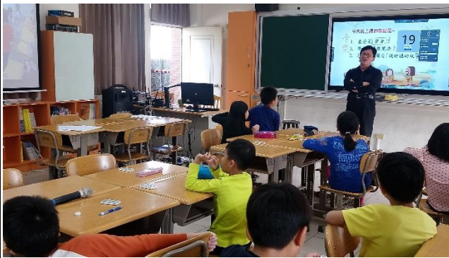
利用挑人模式誘發學生學習。