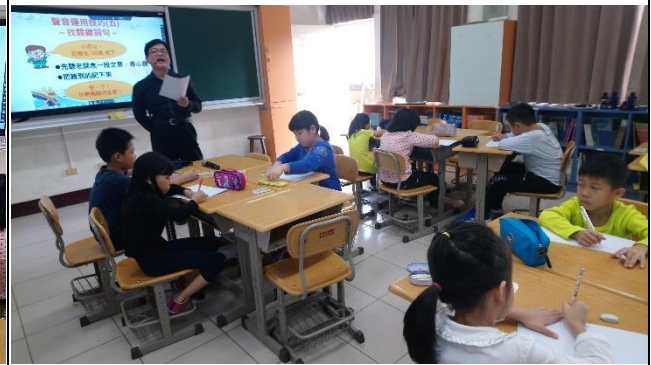
教師帶領學生進行聲音練習。