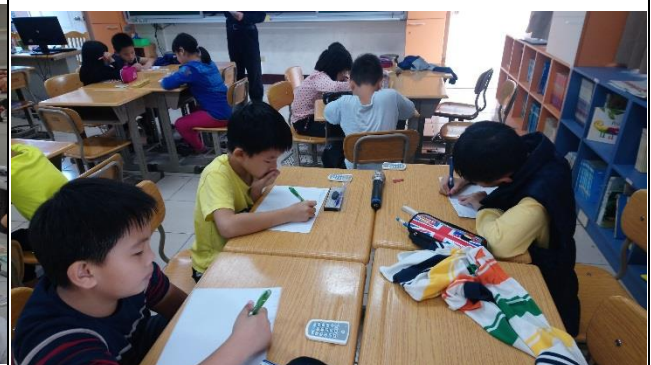
學生檢視劇本並註記。