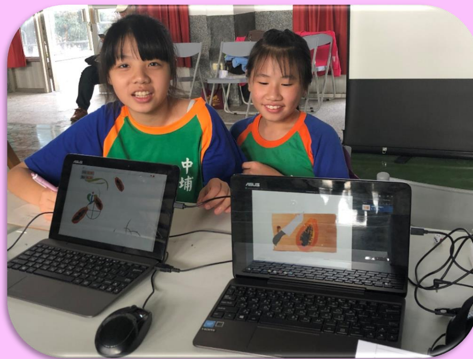
運用筆記型電腦 機動展現學習成果