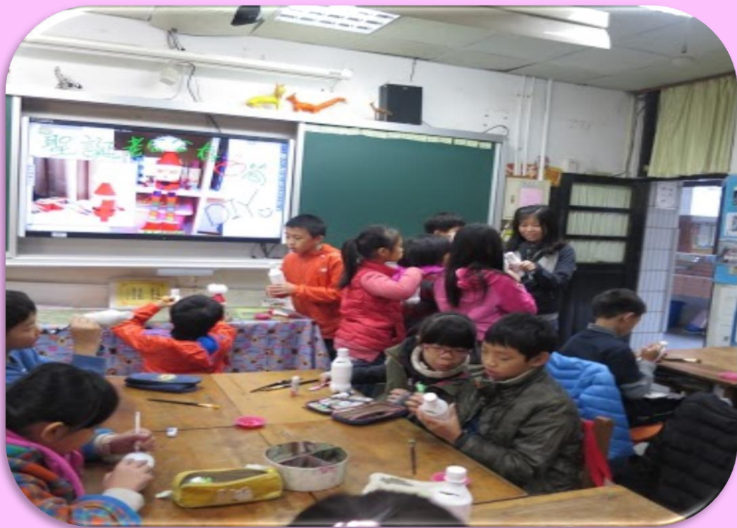
運用大型顯示器 呈現學生藝文作品