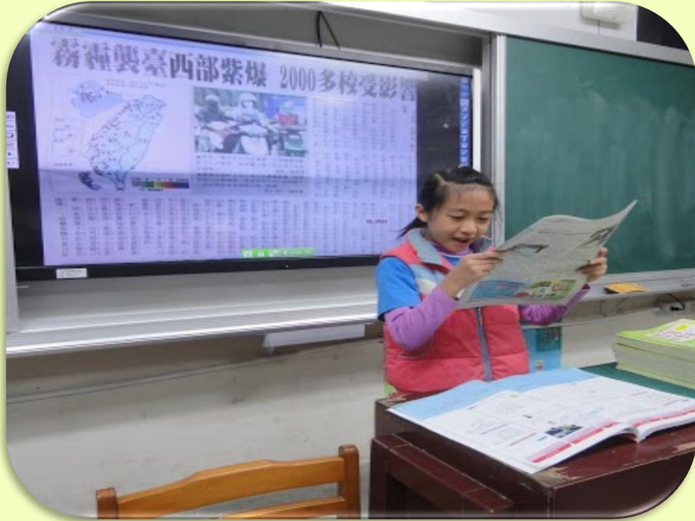
運用大型顯示器 輔助呈現教材內容