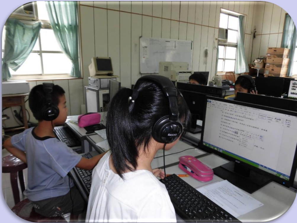
學生運用資訊科技 聆聽語文材料