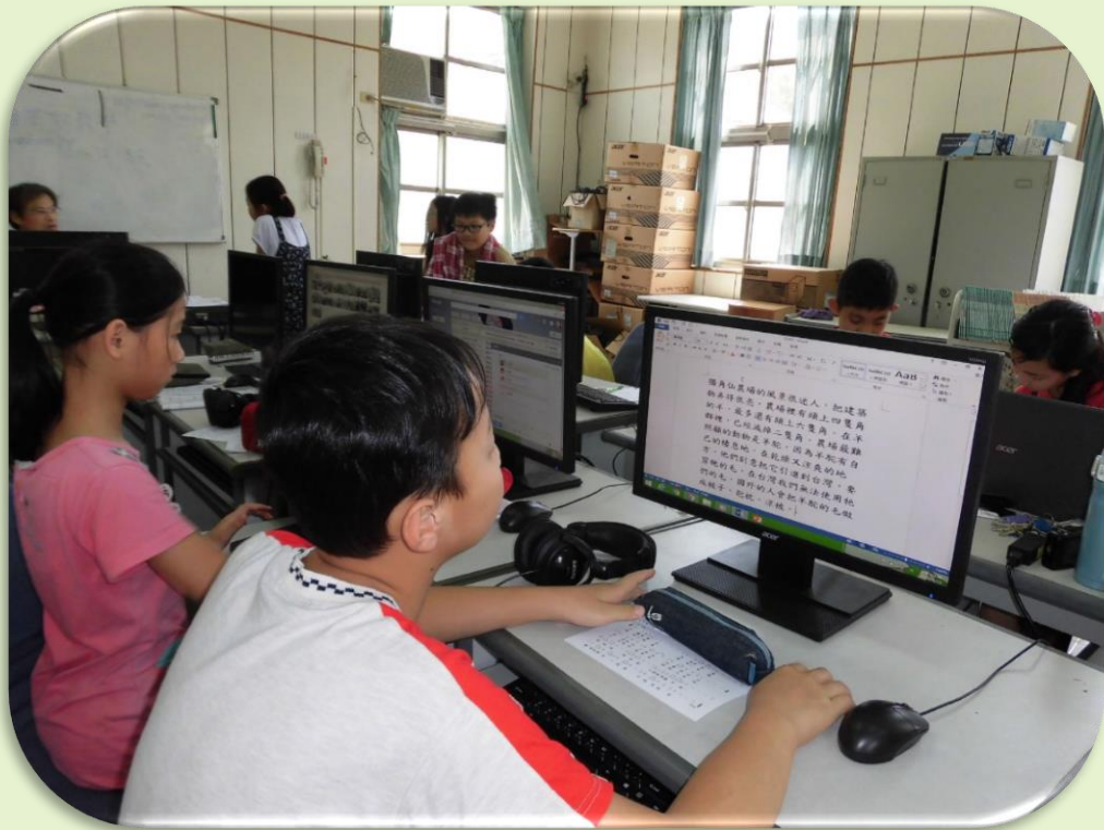
學生運用桌上型電腦 上網查詢資料