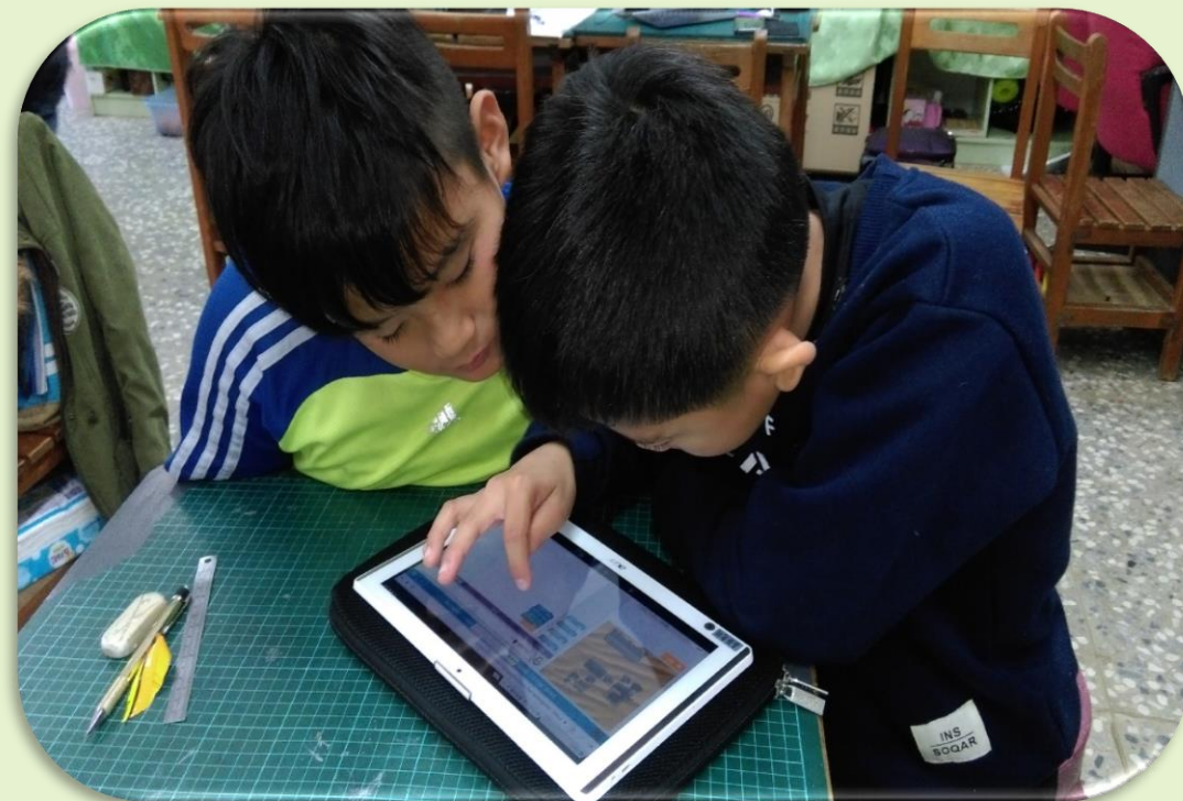
學生運用平板電腦 進行檢索活動