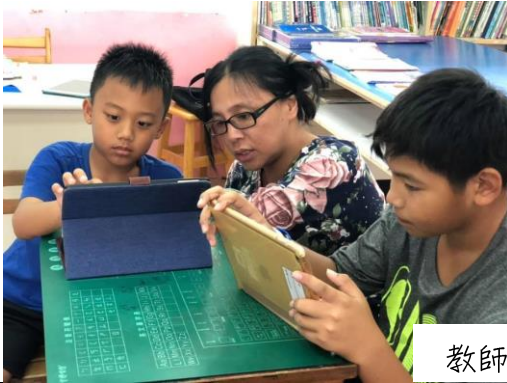
教師指導軟體應用

學生創作約需使用一節課，老師在旁協助(可鼓勵學生畫第二張畫作)，並在學生完成作品後提醒儲存方式。