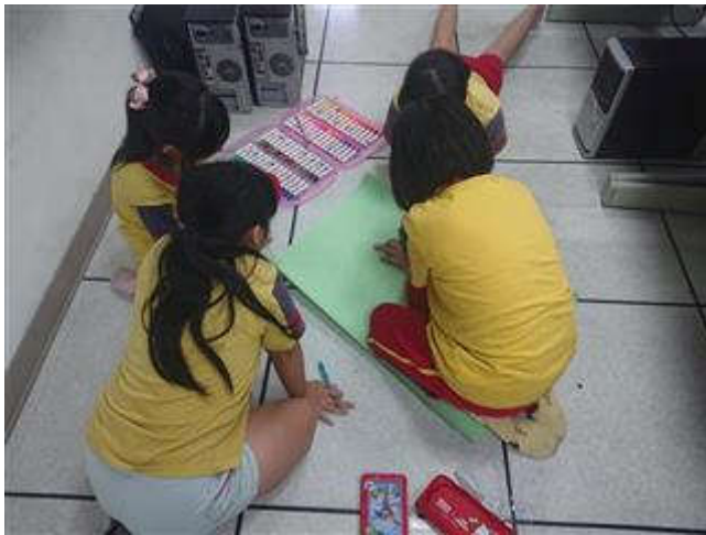
製作流程及相關議題的探討