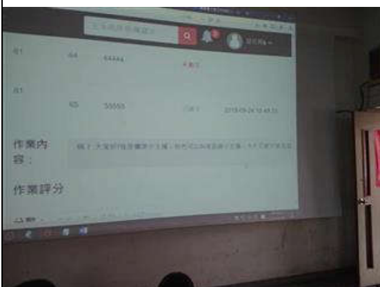
利用網路及學習拍討論課程及及分享