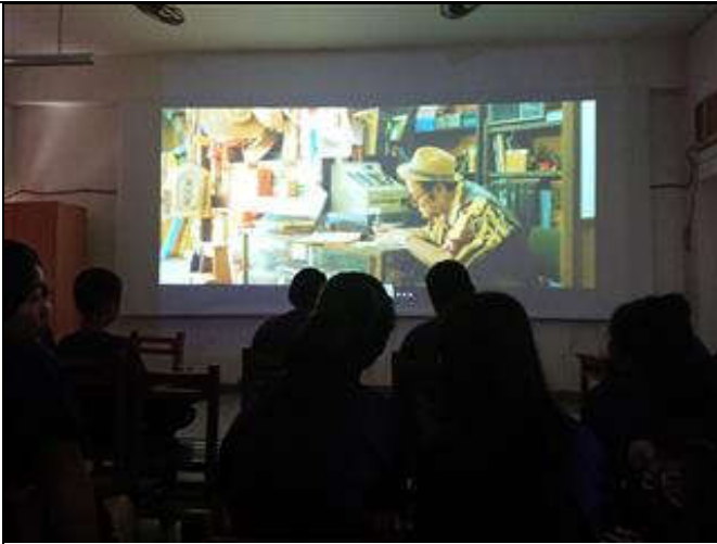
找尋議題及討論議題