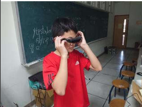
宣傳觀看 vr 影片