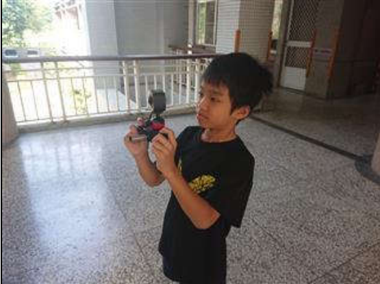
製作 VR 影片及 360 度照片