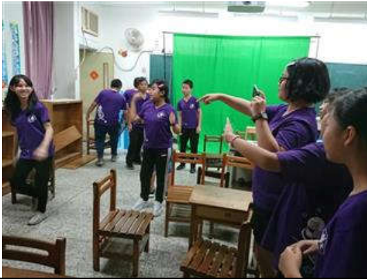
將文字拍攝成影片